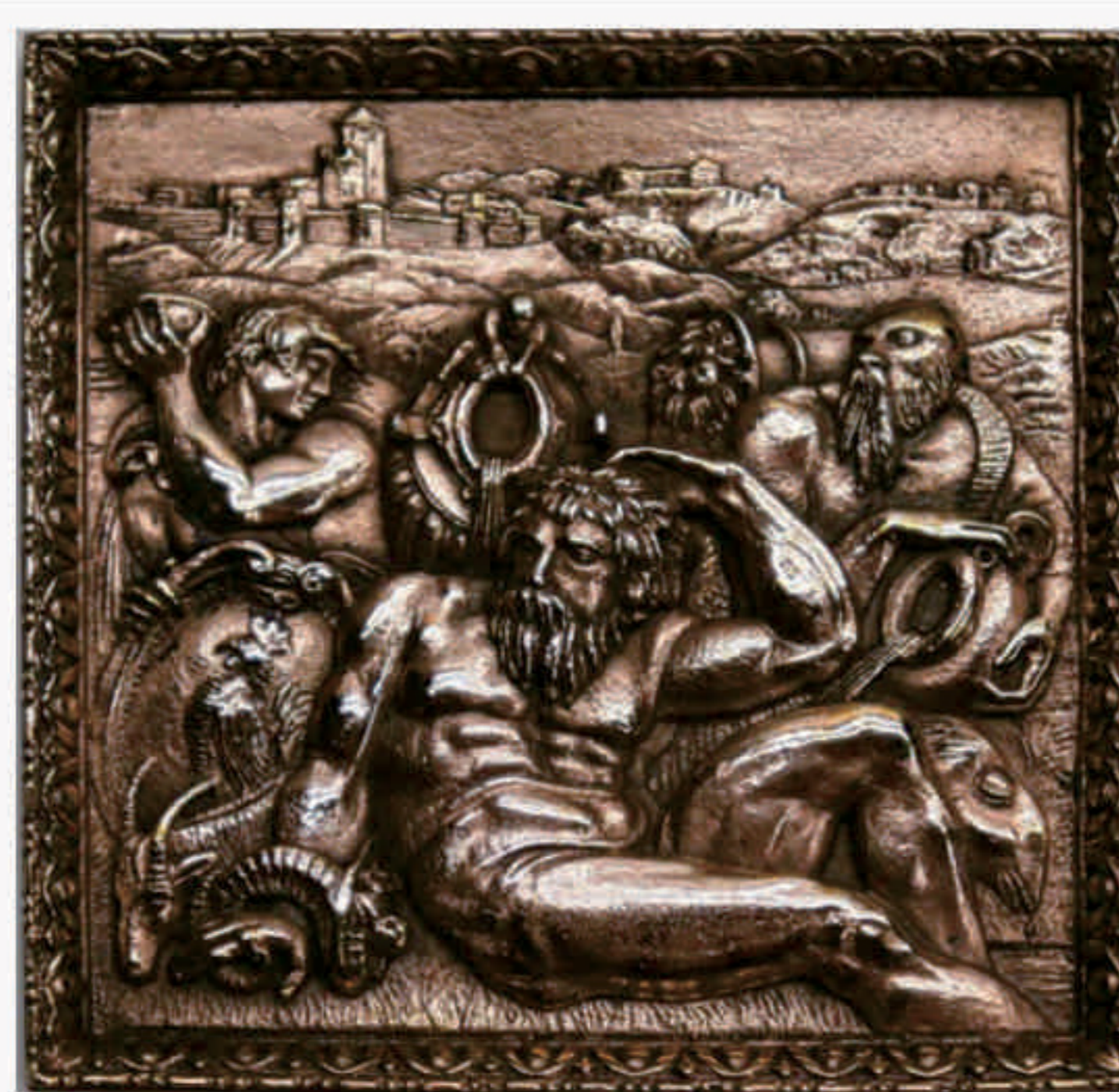
Allegoria del Chianti" (1563-1565).