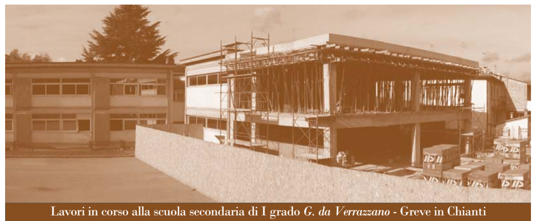
Lavori in corso alla scuola secondaria di I grado G. da Verrazzano - Greve in Chianti

ata negli spazi di un terzo rispetto all'esistente. Ai 14 ambienti attuali, tra spazi per attività didattiche e laboratori, si aggiungeranno presto quattro nuove aule e due gruppi di servizi igienici disposti rispettivamente su due livelli: piano terreno e primo piano. Il lavoro di ampliamento, che si