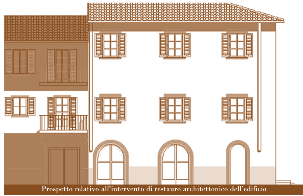
Prospetto relativo all'intervento di restauro architettonico dell'edificio