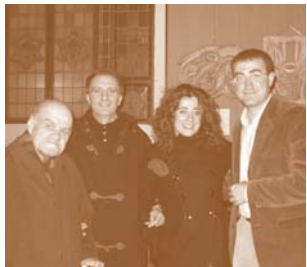
Alcuni promotori del Premio

Nel 1997 il Comune di Greve contava 12.352 residenti. Il 31 dicembre 2006 il numero dei grevigiani è salito a quota 13.954.